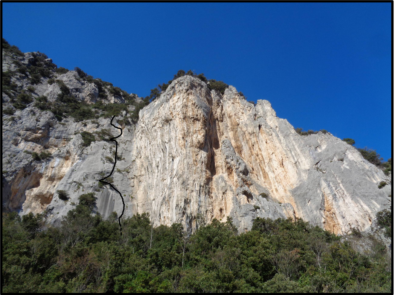
Tracciato della “ Via del placcone ”